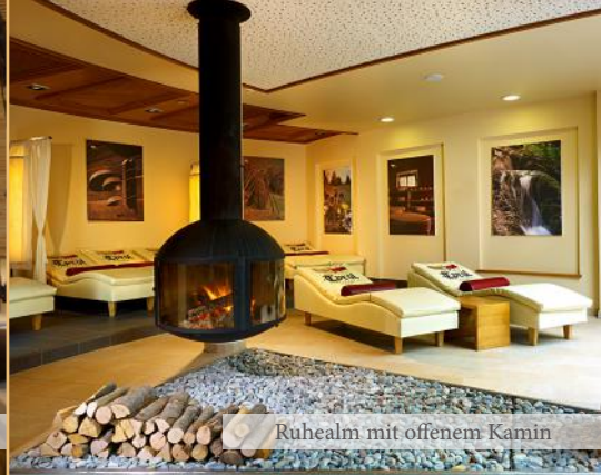
Ruhealm mit offenem Kamin