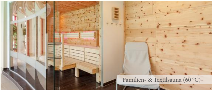
Familien- & Textilsauna (60 °C)