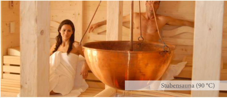
Stubensauna (90 °C)