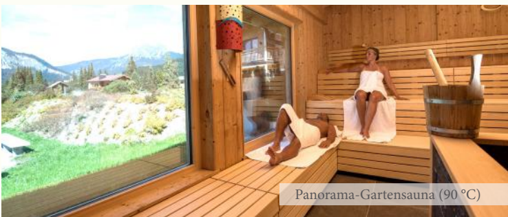
Panorama-Gartensauna (90 °C)